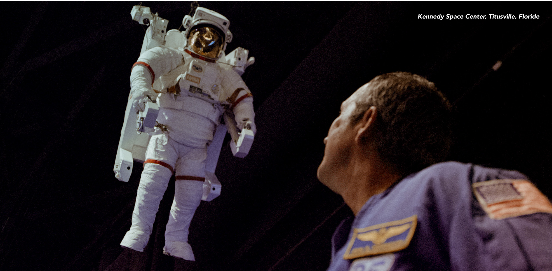
Kennedy Space Center, Titusville, Floride

Pour obtenir d'autres idées de circuits et de voyages aux États-Unis, consultez le site TravelTrade.VisitTheUSA.com