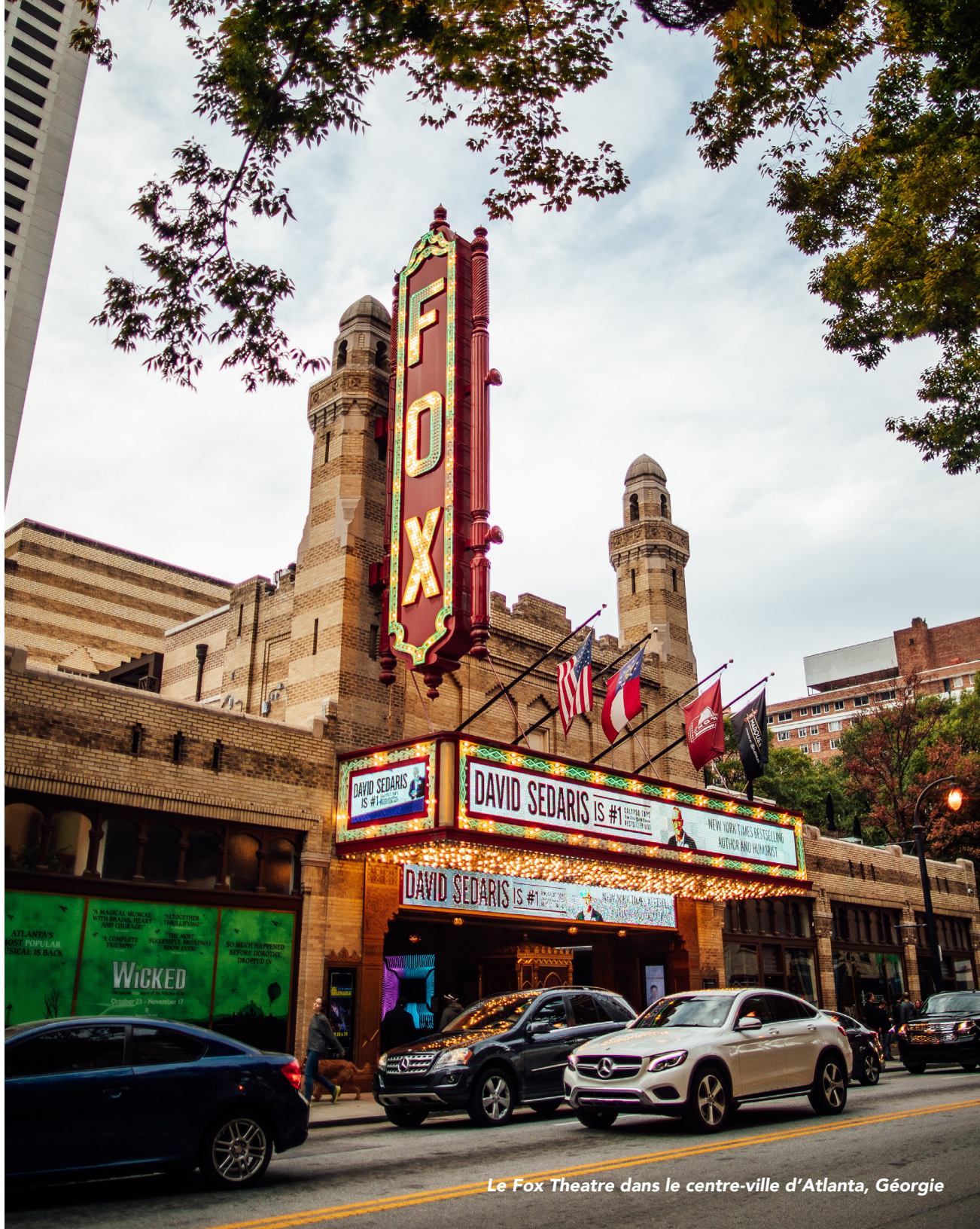
Le Fox Theatre dans le centre-ville d'Atlanta, Géorgie