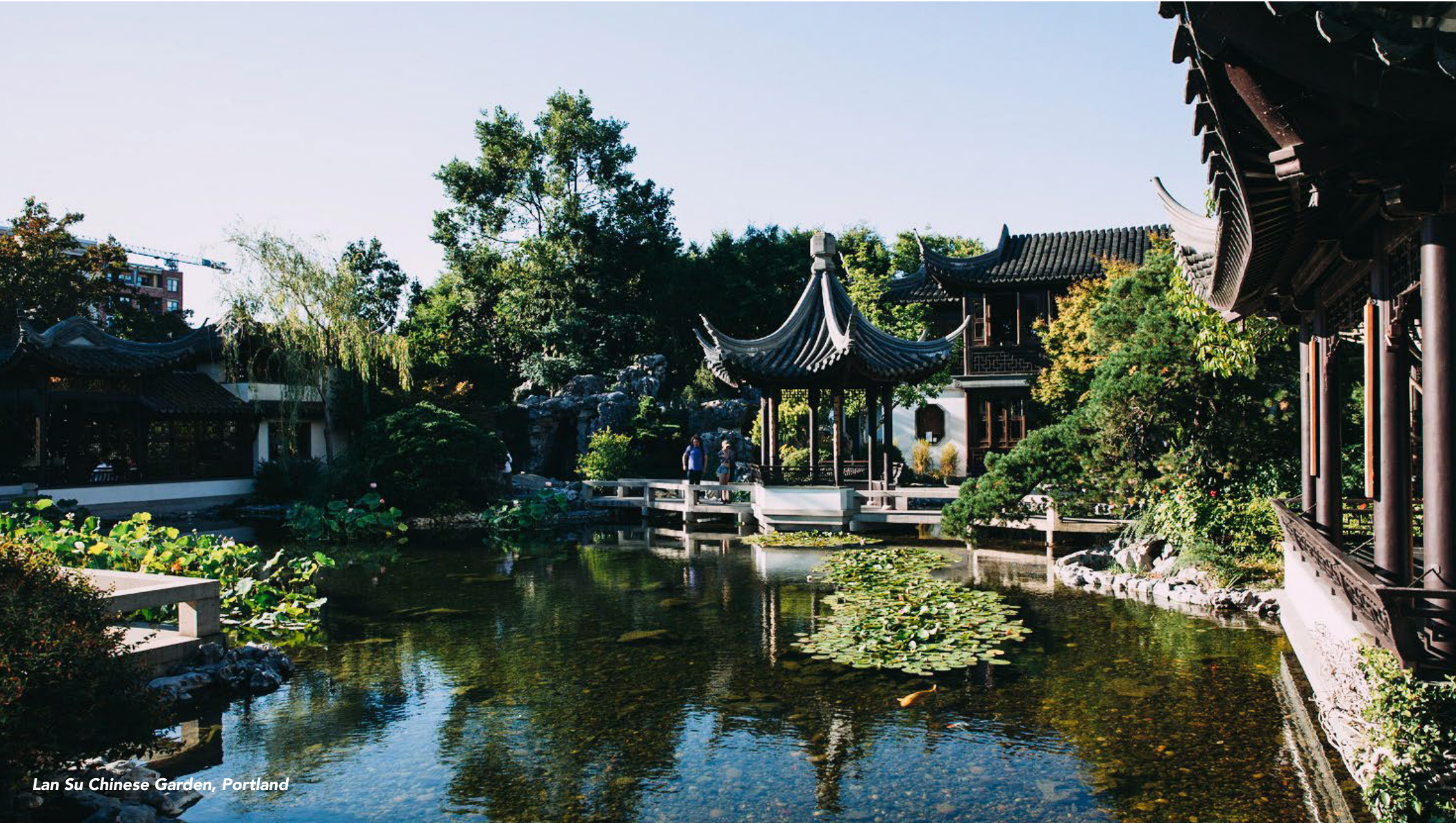
Lan Su Chinese Garden, Portland