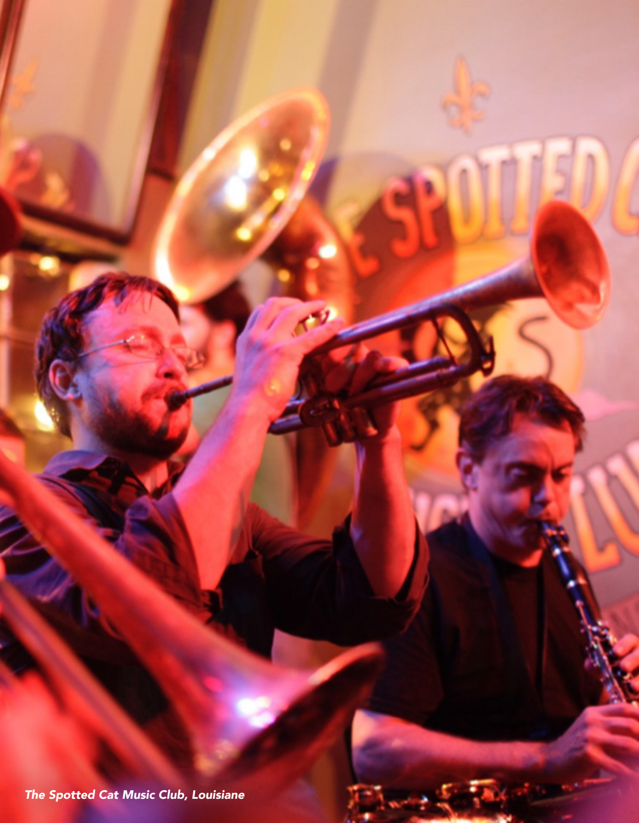
The Spotted Cat Music Club, Louisiane