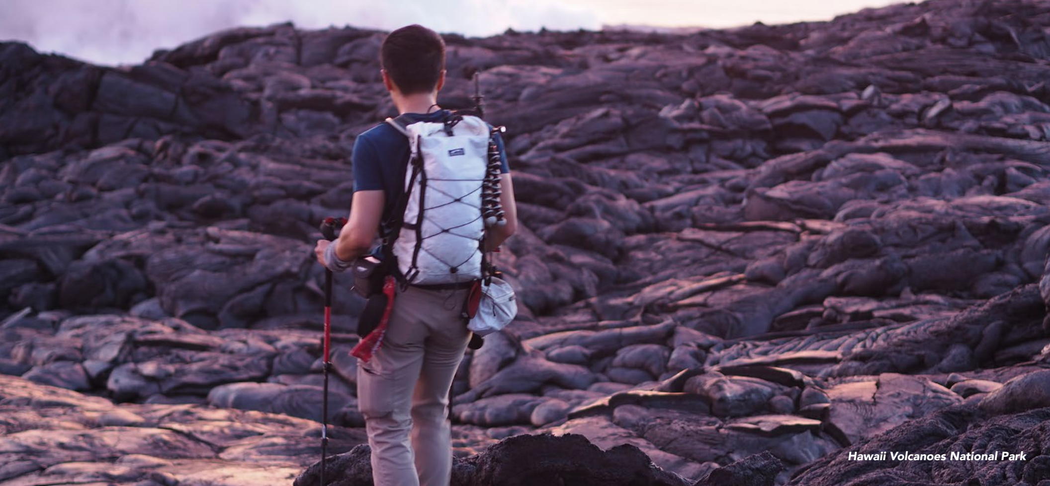
Hawaii Volcanoes National Park