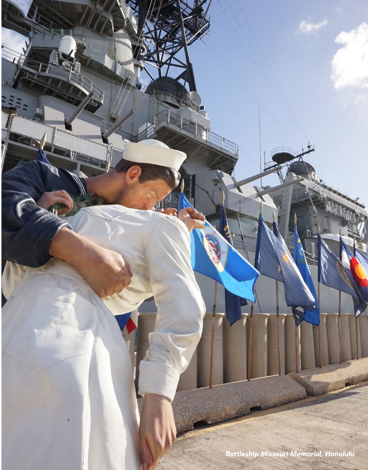
Battleship Missouri Memorial, Honolulu