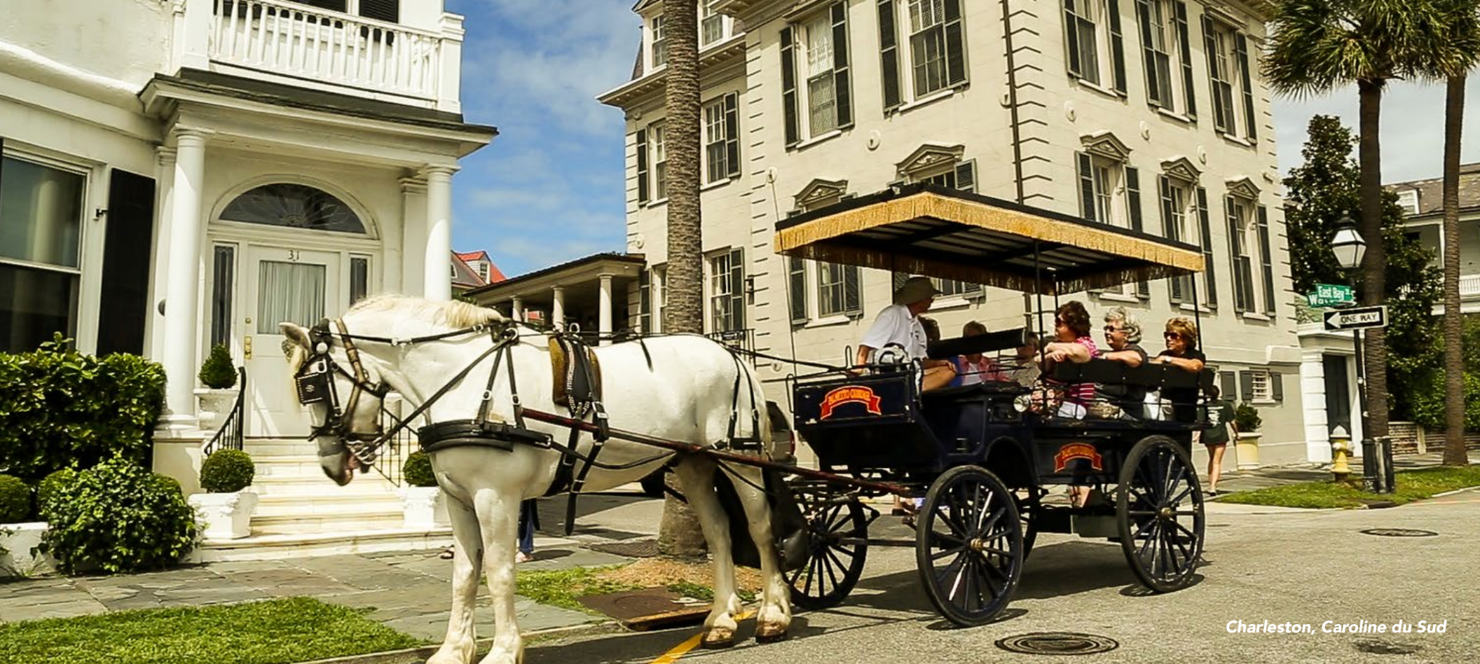
Charleston, Caroline du Sud