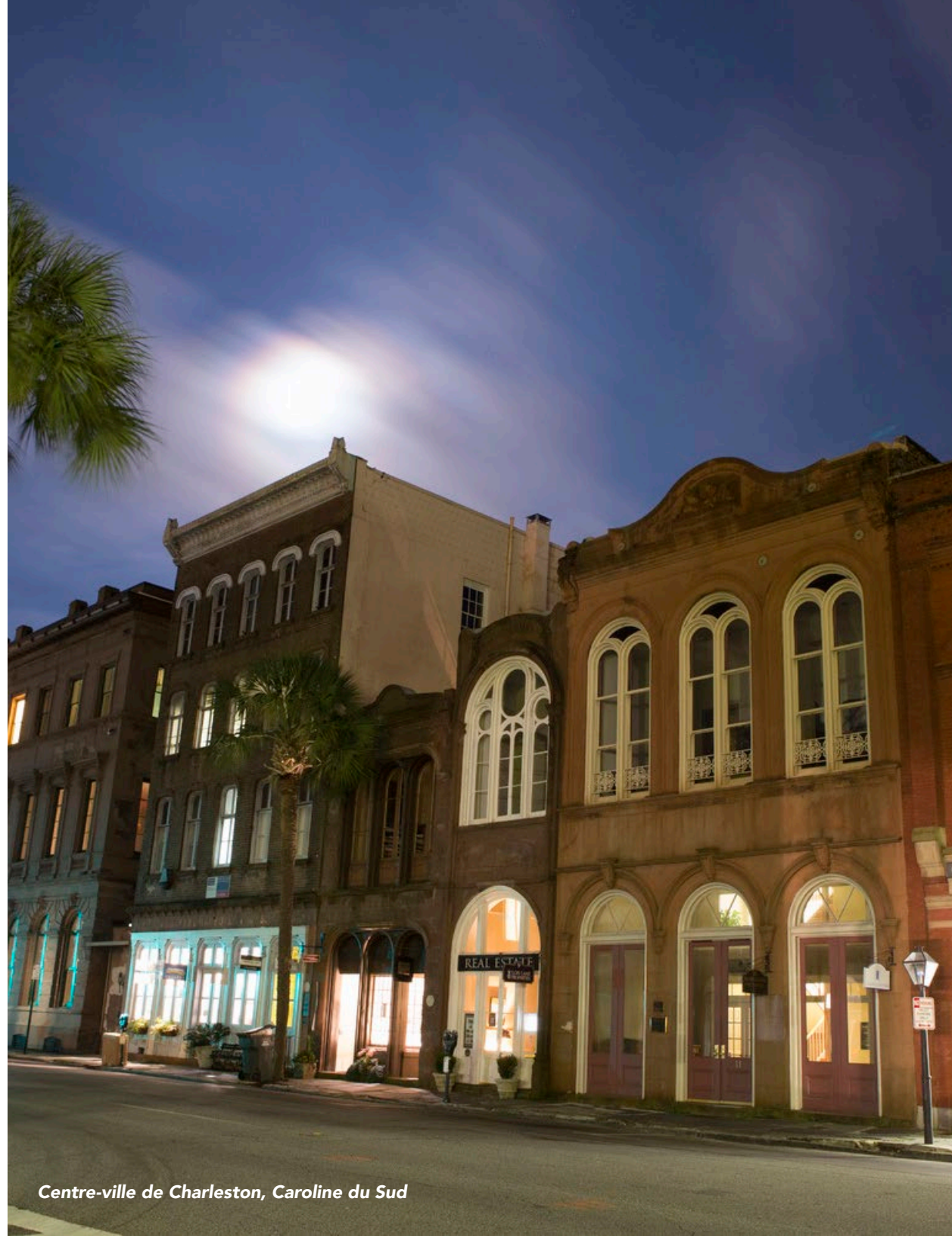
Centre-ville de Charleston, Caroline du Sud