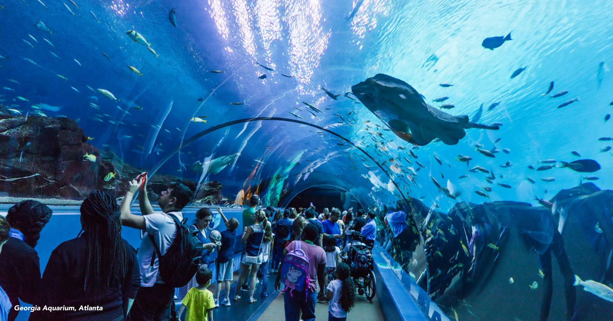
Georgia Aquarium, Atlanta