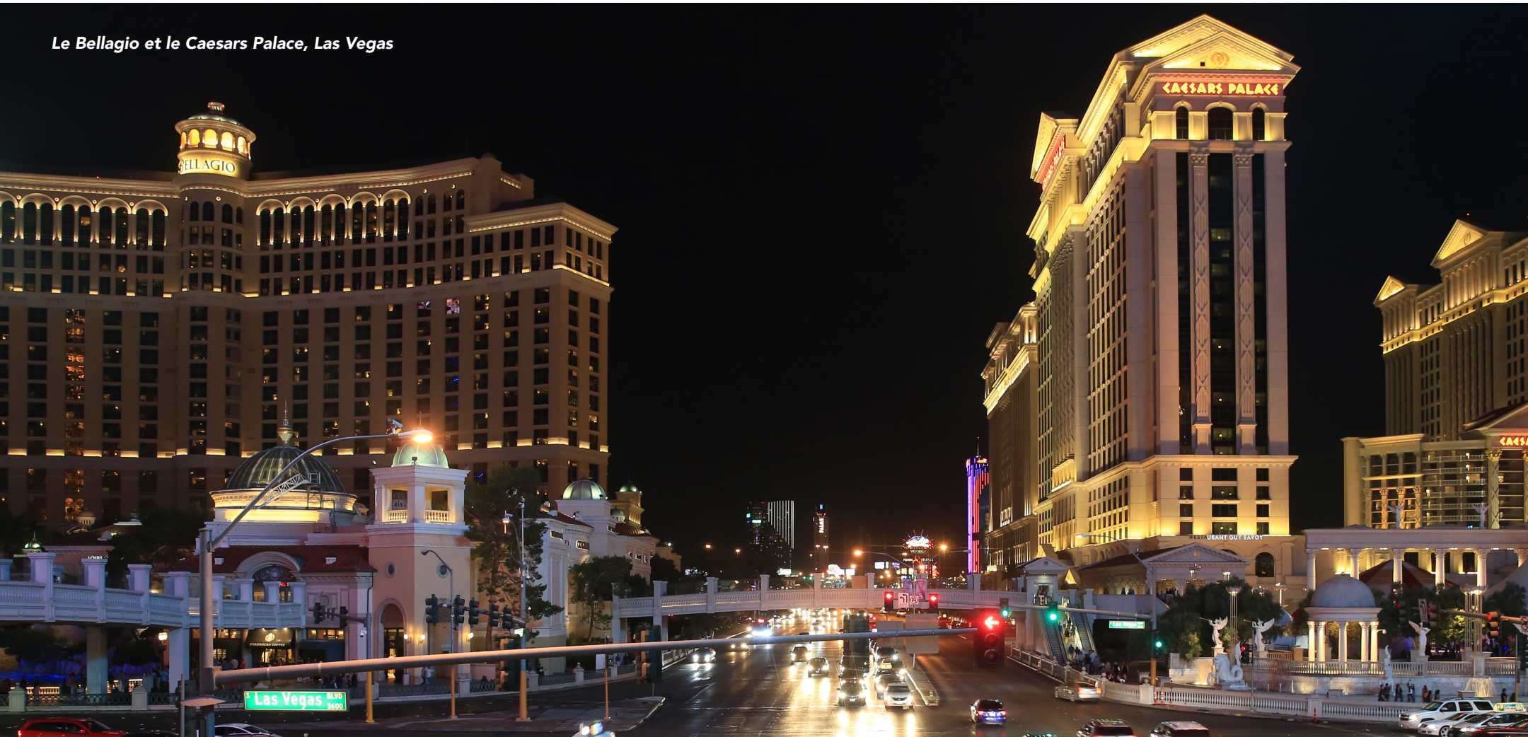
Le Bellagio et le Caesars Palace, Las Vegas