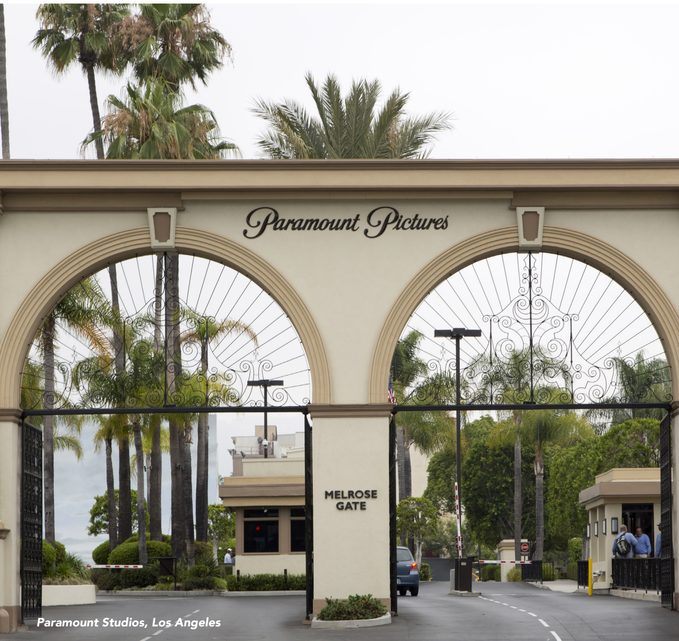
Paramount Studios, Los Angeles

Hébergement: Beverly Hills ou West Hollywood, Californie