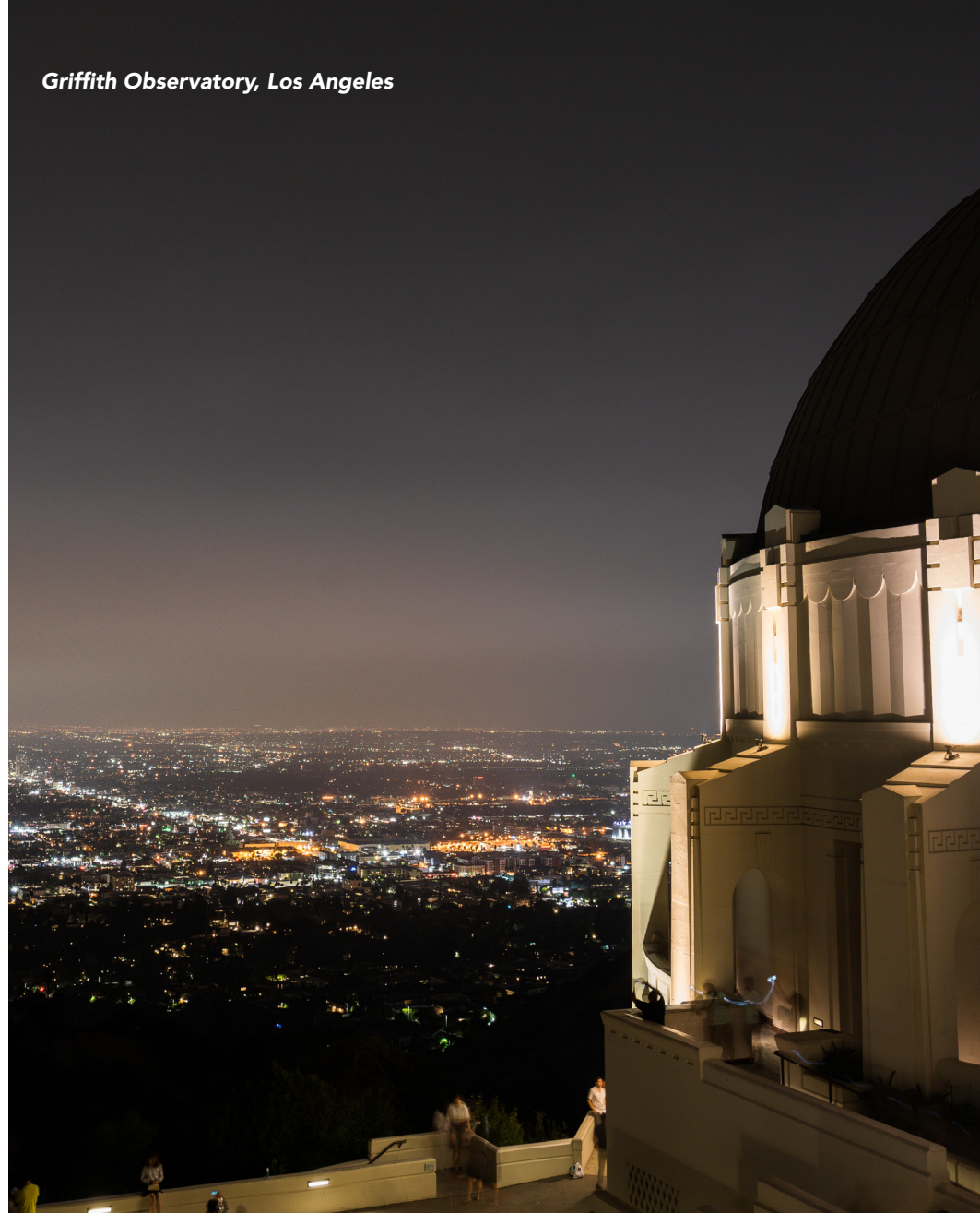
Griffith Observatory, Los Angeles

Hébergement : Beverly Hills ou West Hollywood, Californie