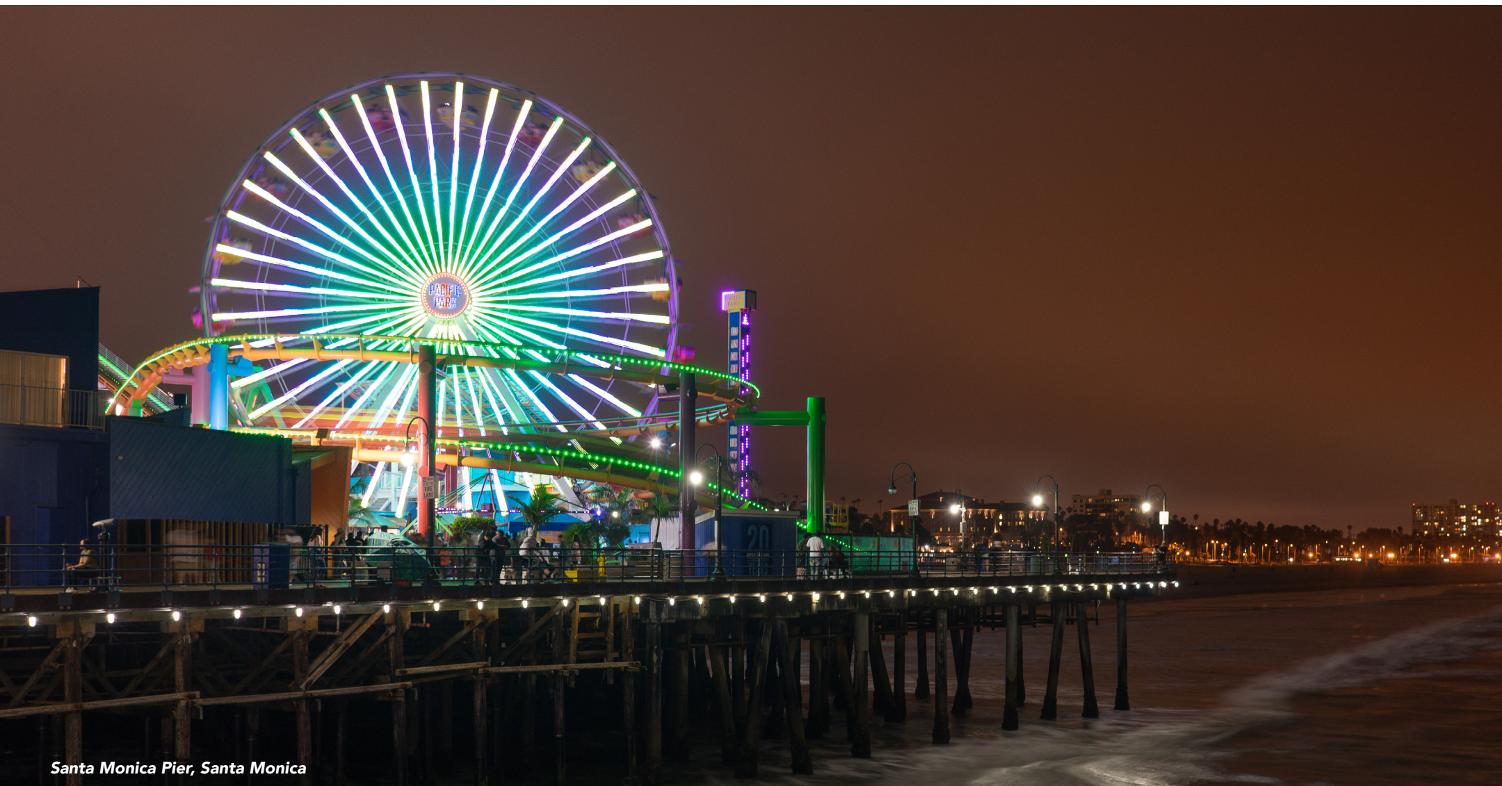
Santa Monica Pier, Santa Monica

« Xanadu », et explorez la magnifique plage. Sur le chemin de l'aéroport, arrêtez-vous à Santa Monica pour admirer la célèbre jetée ainsi que son carrousel et le Looff Hippodrome, que l'on voit dans le film « L'Arnaque ». C'est également là que Forrest Gump « a couru droit vers l'océan ». Profitez d'un dernier déjeuner avant de faire vos adieux à la capitale mondiale du cinéma.