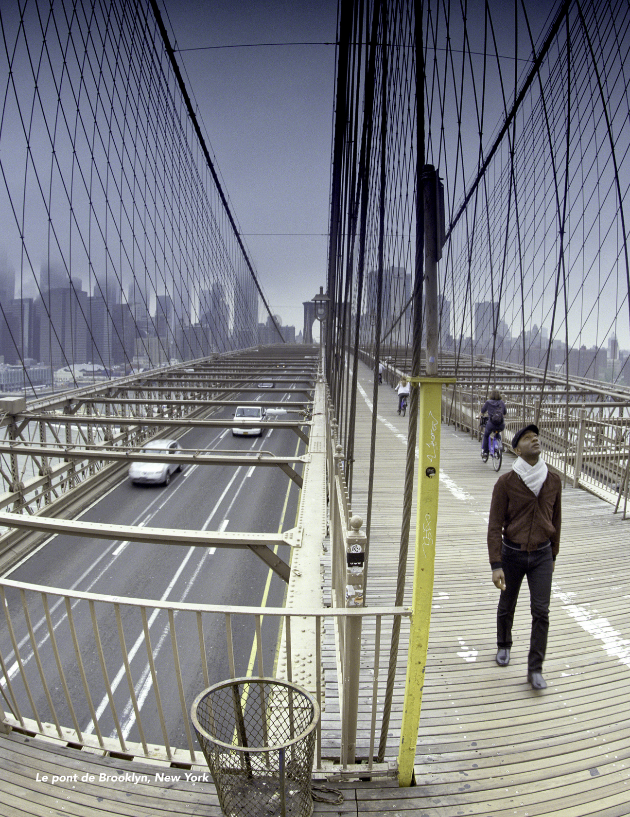
Le pont de Brooklyn, New York