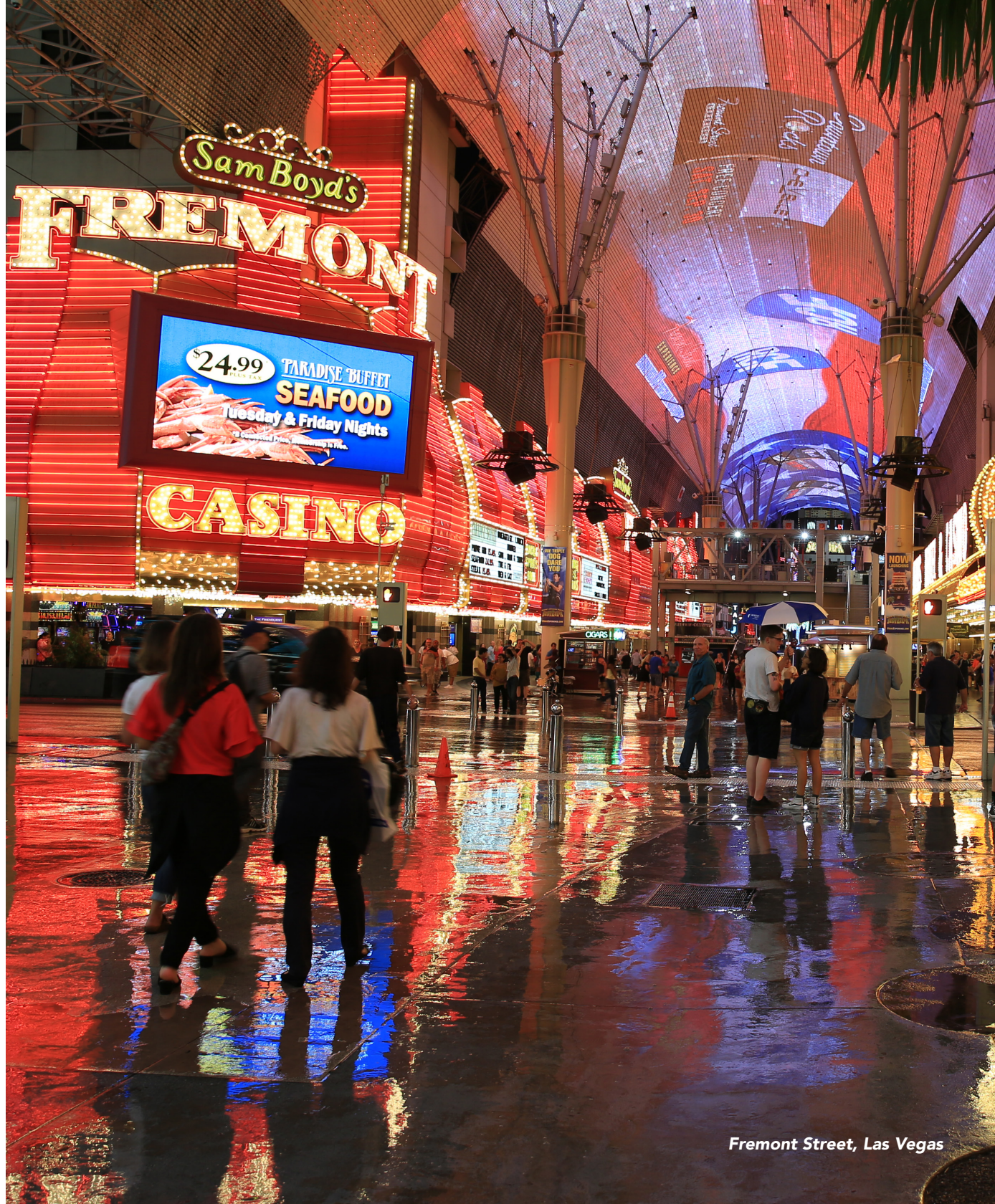
Fremont Street, Las Vegas