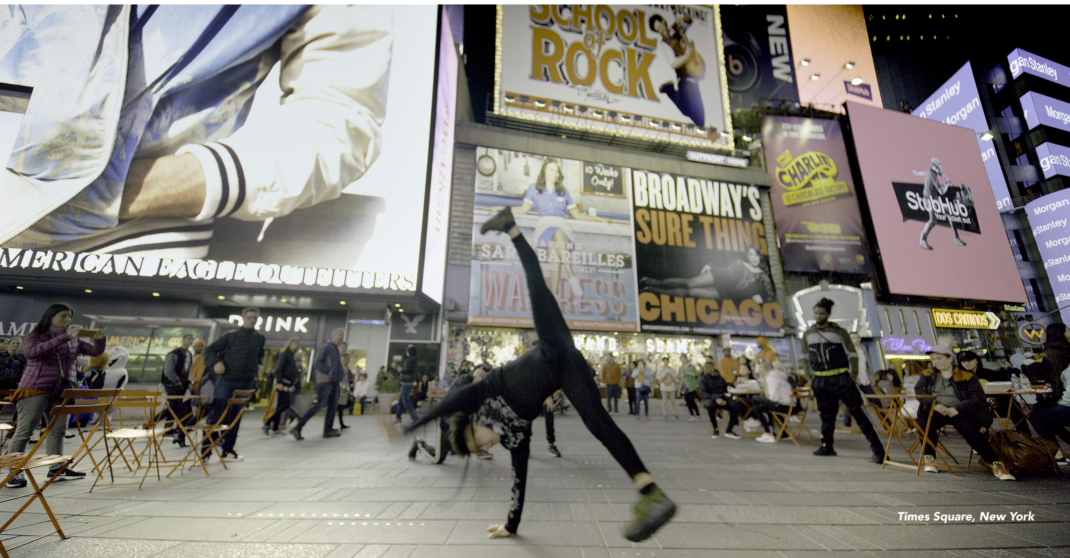
Times Square, New York