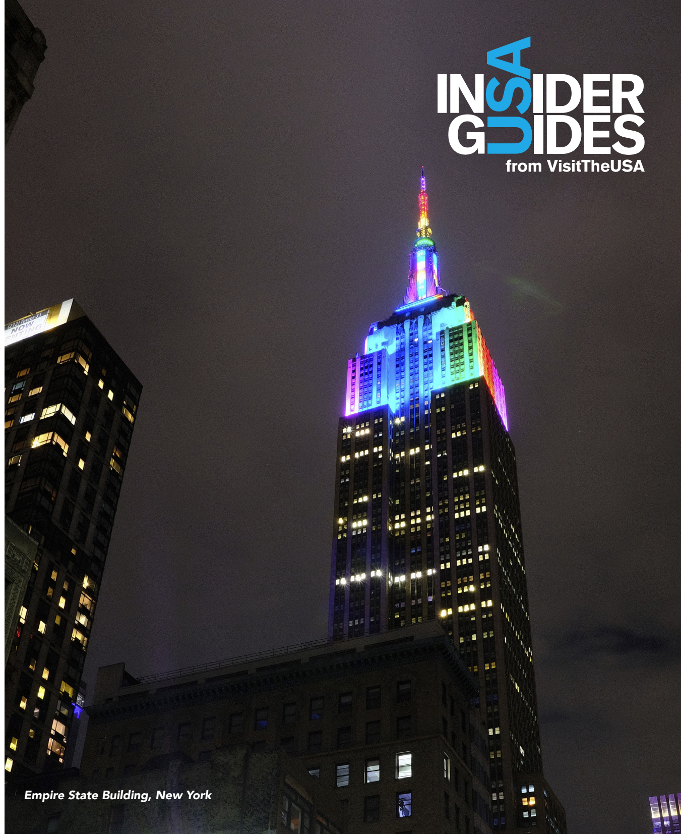
Empire State Building, New York